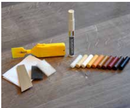
Hartwachs-Reparaturset Artikel-Nr. 1101060150

Für die Reparatur von kleinen Schäden in Bodenoberflächen (z.B. Kratzer, Druckstellen, kleine Löcher).